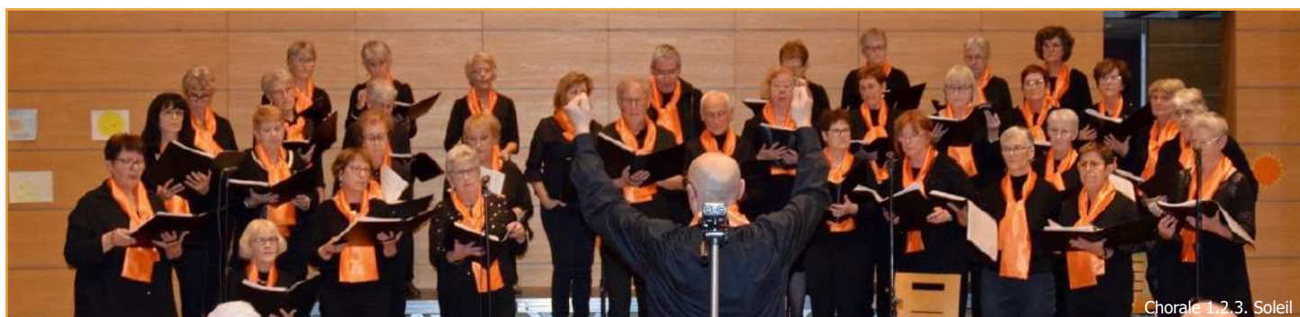
Chorale 1.2.3. Soleil