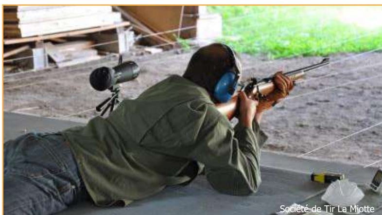
Société de Tir La Miotte

Mairie (salle des Citronniers) | De 10 h à 12 h et de 14 h à 17 h