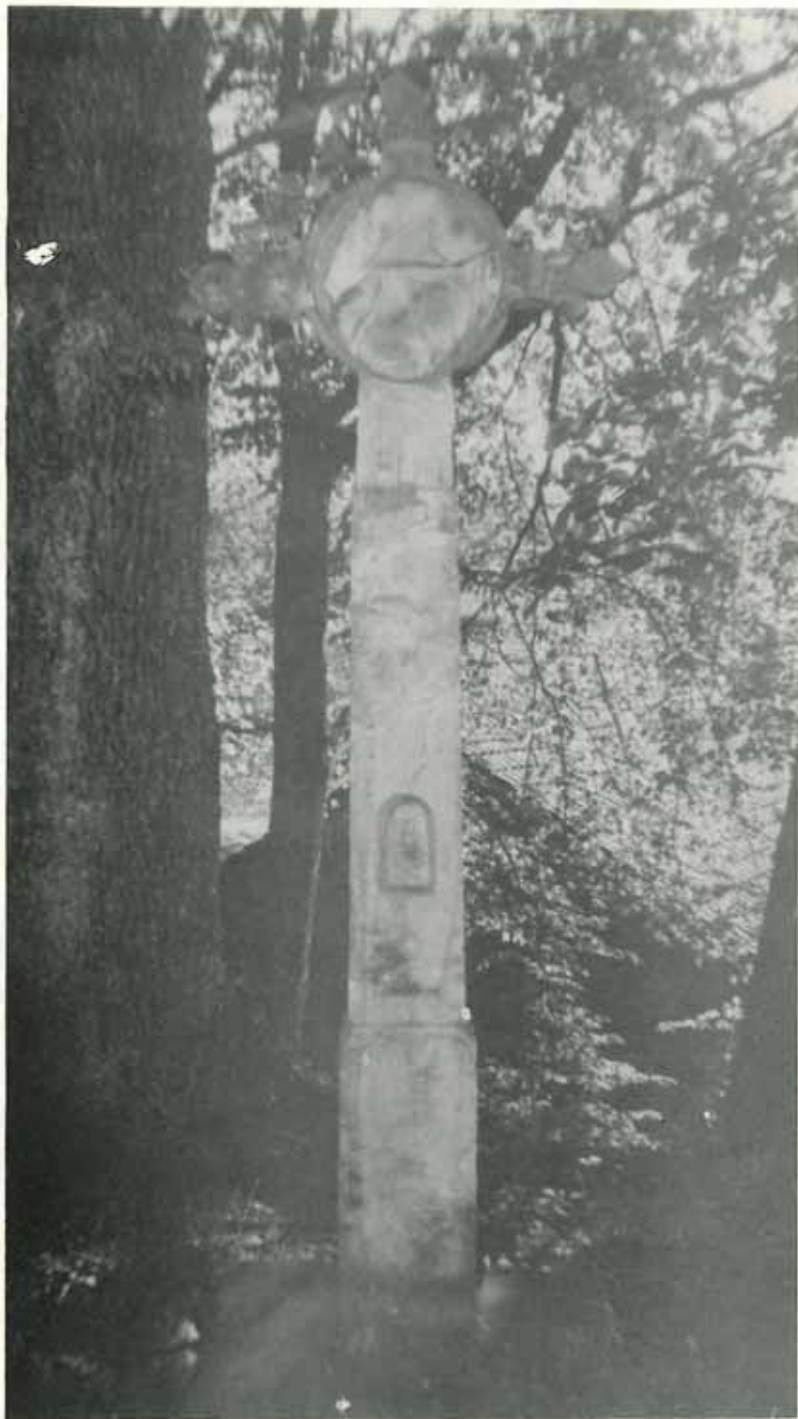
Très belle croix en grès datant de 1712. Route des Soiras - Photo H. JECKER