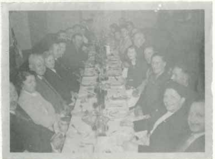
Les Anciens Combattants en goguette... à la carpe d'or, chez l'Auguste ou chez la Marie.