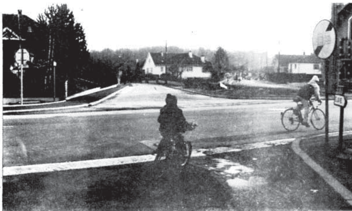
Le Carrefour rue des Prés, rue de l'Etang, rue de Gaulle en cours d'aménagement.