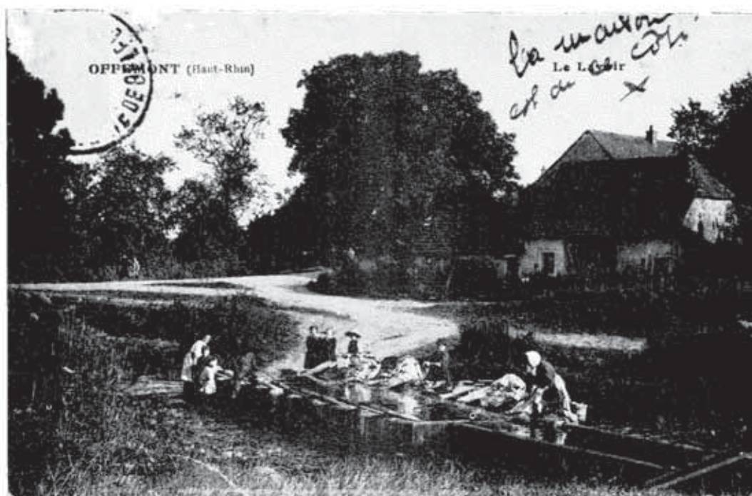
Le carrefour rue A. Briand, rue du Ballon et rue des Eygras, un siècle avant l'édification de l'hôtel "Mon Village".

JEAN FAUCOGNEY 4 rue Paul Cezanne OFFEMONT tél : 84 26 46 79