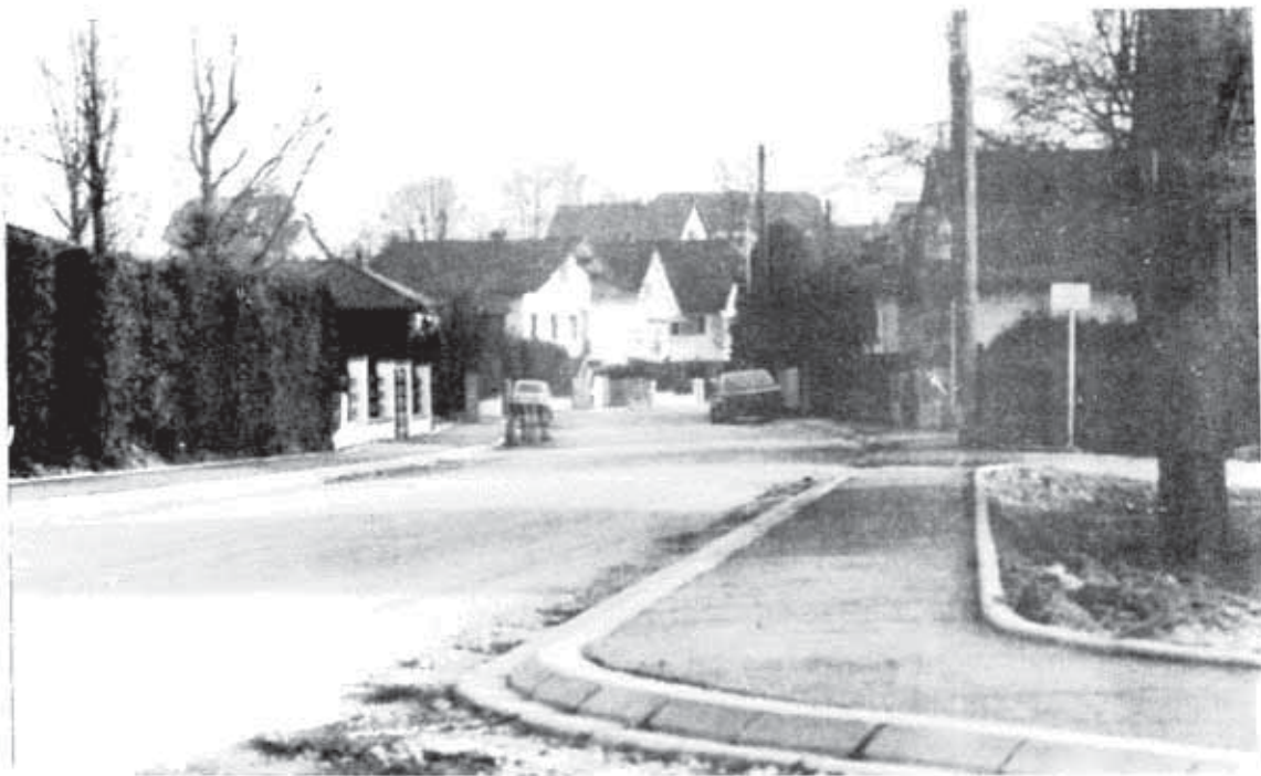
La rue des Cerisiers fait peau neuve : Les trottoirs protégeront piétons et riverains, et les îlots directionnels ralentiront la vitesse des véhicules automobiles